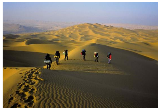
タクラマカン砂漠