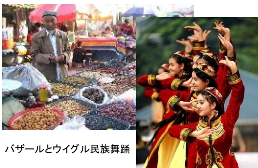
バザールとウイグル民族舞踊