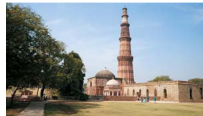
クトゥブ・ミナール